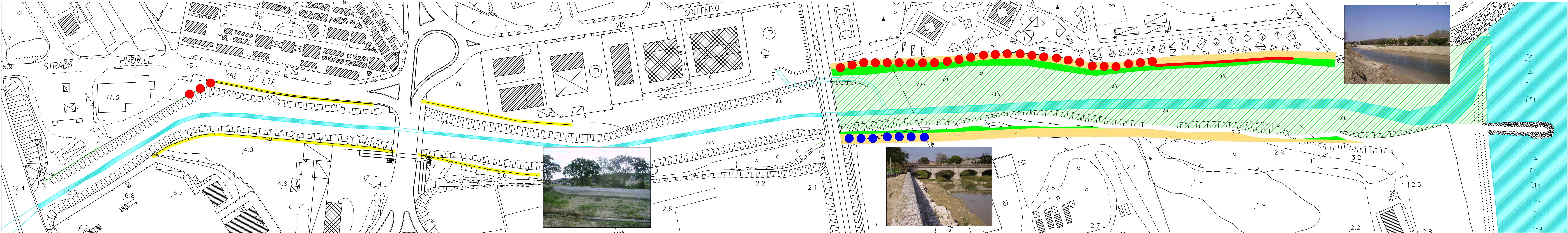
FIUME "ETE VIVO": INTERVENTI ESEGUITI DAL COMUNE DI PORTO SAN GIORGIO CON FINANZIAMENTI EUROPEI POR-FESR